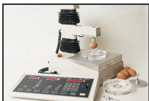
Firmeza de la cáscara (QC-SPA)