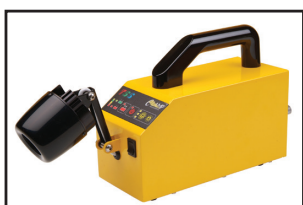
Egg candling lamp (eLAMP)