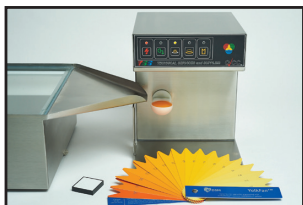
Color de la yema (QCC)