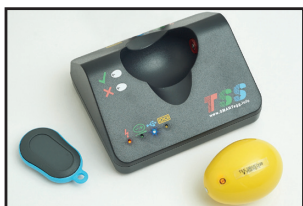
Egg damage testing (SMARTegg)