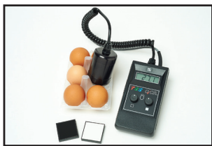
Color de la cáscara (QCR)