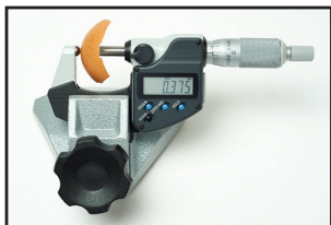
Grosor de la cáscara (QCT)