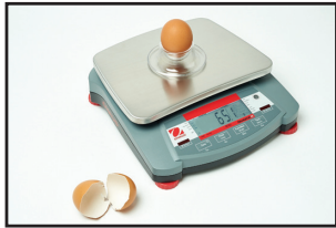
Peso de la cáscara del huevo (QCBi-XT)